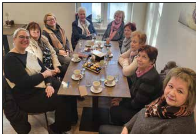
Briške žene na degustaciji pri Mjrki

V letošnjem letu nas čaka še kar nekaj prireditev, zato lepo vabljeni na obisk. Odprte pa so tudi prijave za članstvo v društvu, kjer z veseljem sprejmemo tiste, ki kuhajo, pečejo, prodajajo ali imajo žilico za socialna omrežja.