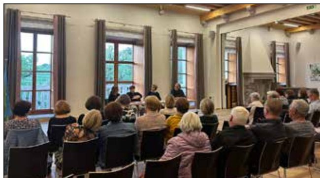
Javna razprava domsko varstvo starejših Brda