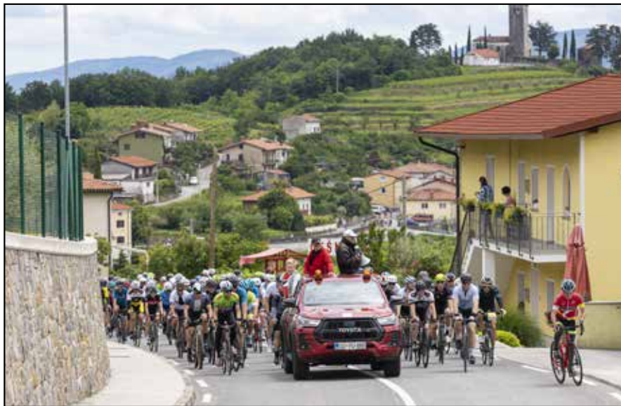
Glavnina kolesarskega maratona iz Kojškega v Gonjače

Pot rekreativnega maratona je dolga 108 kilometrov. Maratona se je letos udeležilo 768 kolesarjev z vse Slovenije in tudi tujine. Kar nekaj udeležencev smo zabeležili iz sosed-