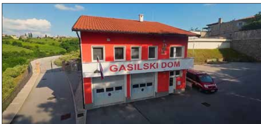
Gasilski dom Dobrovo

Fotografija: arhiv Občine Brda in Matej Srebrnič; posnetki iz zraka