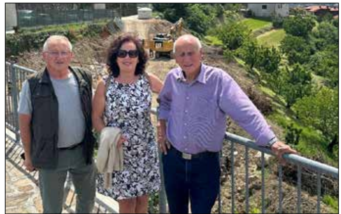
Obisk gradbišča parkirnih mest v Šmartnem

Celotna prva faza izgradnje parkirišč pod t. i. Padrati predvideva izgradnjo 21 parkirnih mest. Ko bo zaključ-