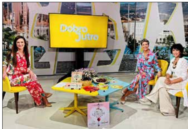
Oddaja Dobro jutro

17. maja smo gostovali v oddaji Dobro jutro v koprskem studiu RTV SLO.