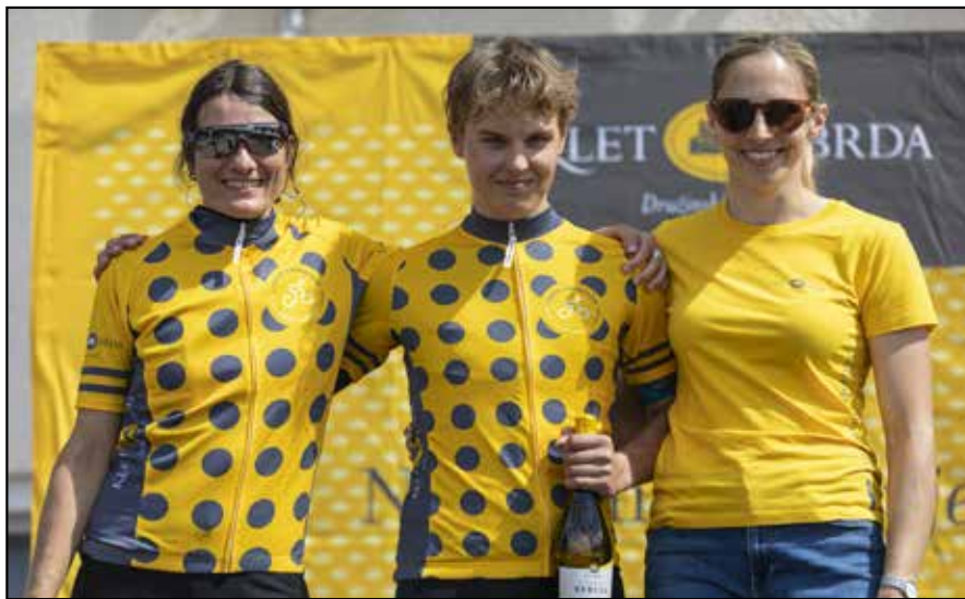
Dobitnika pikčaste majice

nje Italije in celo Švice. Klet Brda na cilju posebej nagraduje najstarejšega in najmlajšega udeleženca oz. udeleženko, najštevilčnejšo družino ter najštevilčnejše klube. Najstarejši udeleženec je letos štel častitljivih 85 let, najmlajši pa 11 let. Najštevilčnejši klub je bil letos Kolesarski klub Brda, sledil je kolesarski klub Ome-