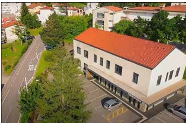
Zdravstveni dom Dobrovo