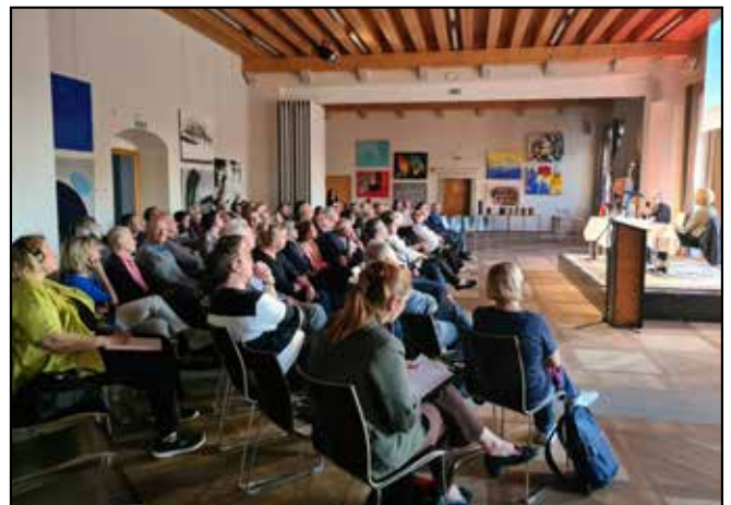
Občinstvo med predavanjem Lucie Pillon