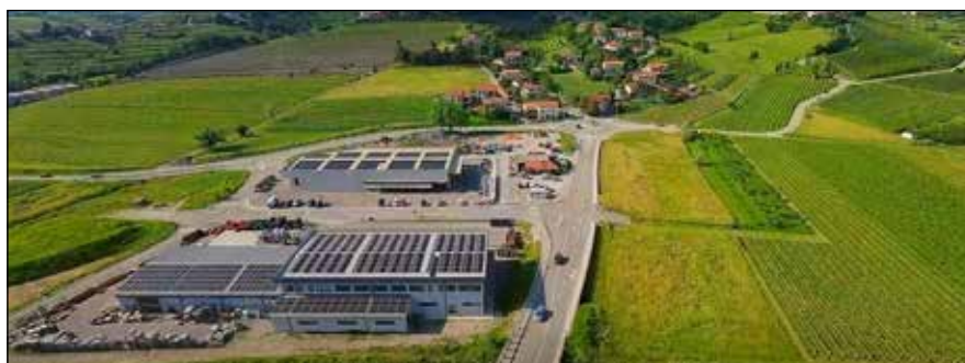
Poslovna cona Dobrovo