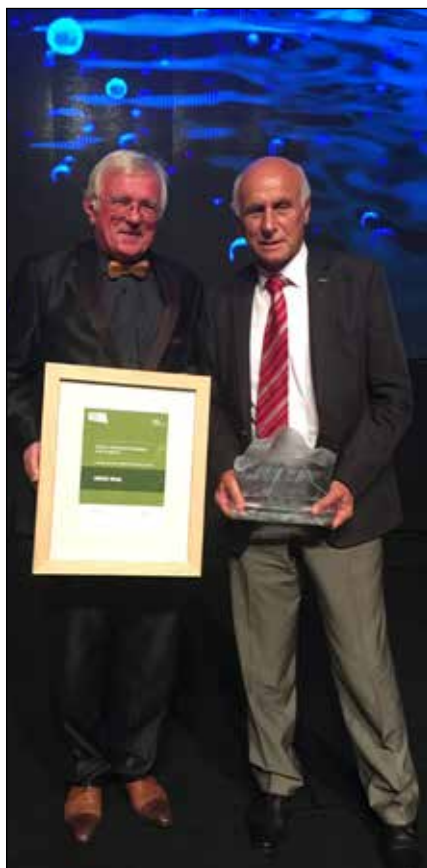
Brda - Kristalni Triglav 2016

Ta pregled je osvetlil samo med nekatere izmed številnih dosežkov in mejnikov v občini. Vsako vas, vsak kotiček Brd je v treh desetletjih objel razvojni duh, odprle so se številne storitvene in turistične objekte, obnovili so domačije in kmetijske površine, razvijali takšne in drugačne poslovne zgodbe. Prepoznavnost in uspeh našega območja nenazadnje tlakuje sleherni član briške skupnosti.