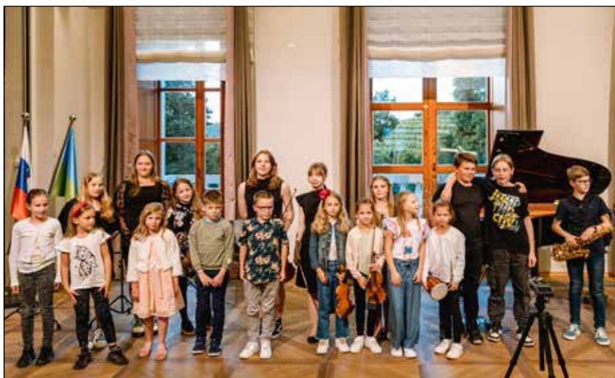
Zaključni koncert učencev Glasbene šole Nova Gorica v Vili Vipolže

V Vili Vipolže so 24. maja odmevali glasni aplavzi. Vznemirjenje učencev Glasbene šole Nova Gorica, ki so želeli na zaključnem koncertu pokazati vse pridobljeno znanje, je že ob uvodnem nastopu preglasilo navdušenje staršev, učiteljev in ostalih poslušalcev, ki so spremljali 19 briških osnovnošolcev.