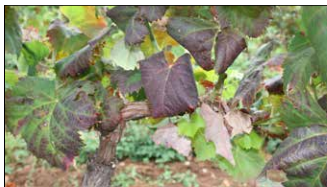
Simptomi okužbe z zlato trsno rumenico pri rdečih sortah