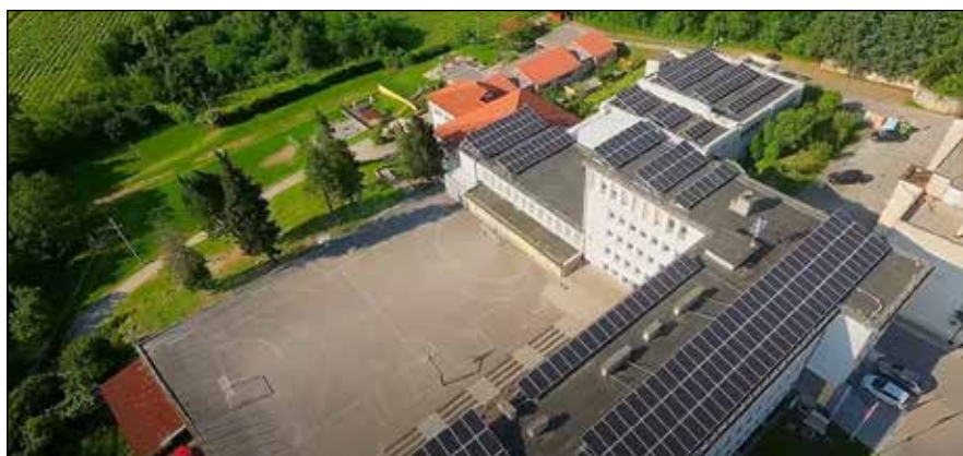
Šolsko igrišče in prizidki pri OŠ Alojza Gradnika Dobrovo