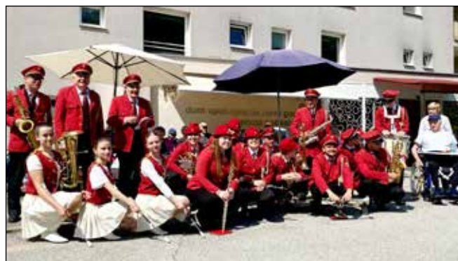
Dan mladosti - Dom upokojencev Podsabotin