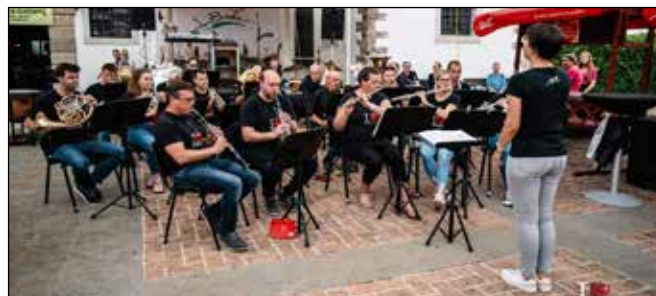
Festival briške češnje

Dan kasneje smo v dopoldanskih urah hiteli prati in likati srajce, kajti popoldne sta nas čakala kar dva nastopa. Z našimi melodijami smo se ob 80. obletnici vojnih zločinov in grozot poklonili žrtvam, 10 talcem v Gornjem Cerovem in 22 ujetnikom v goreči hiši pri Peternelu.