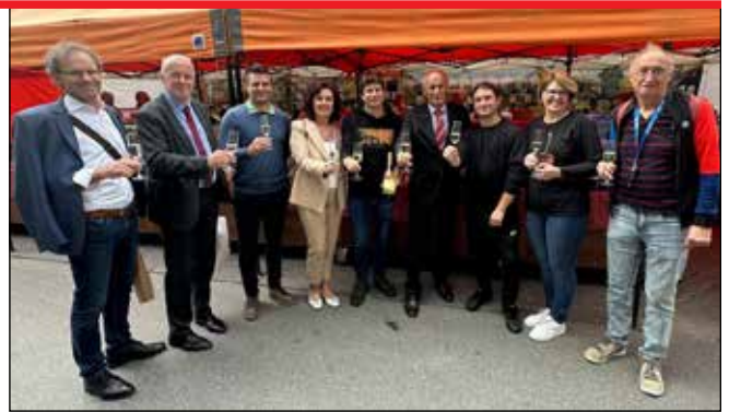
Uspešnemu dnevu v Celovcu so nazdravili predstavniki briške občine, AACC, sodelujoči na mini festivalu češenj in kmetije Moro