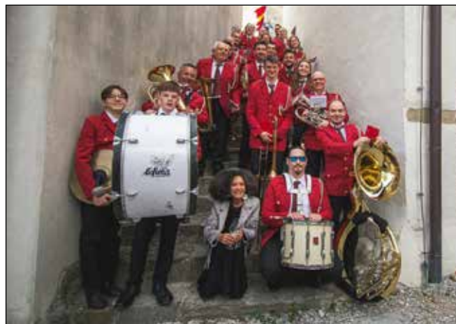
Brda in vino

20. aprila smo ponosno zakorakali po šmartenskih ulicah. Z udarno glasbo, predvsem pa našo energijo smo prevzeli slehernega obiskovalca odmevne in prepoznavne prireditve Brda in vino. V čast in neizmerno veselje nam je, da so nas organizatorji prepoznali in umestili v izbor kvalitetnih glasbenih izvajalcev in nam dali možnost in priložnost, da se predstavimo. Med prebivanjem skozi množico navdušenih obiskovalcev smo ponosno prepevali poznan refren: »Veselo vam igra, ta naša muzika, če kdo nas ne pozna, iz Brd smo mi doma!«. Ponovno smo se odzvali povabilu Osnovne šole Alojza Gradnika Dobrovo in obiskali učence prve triade šole na Dobrovem, kasneje pa še v podružnične šole v Kojskem. Posamezni člani orkestra smo, ob pomoči učencev naše Godbeniške šole Brda in učencev Glasbene šole Nova Gorica, pripravili pravo glasbeno poslastico. Predstavili smo naše inštrumente, delovanje godbeniške šole ter učencem zaupali majhne skrivnosti iz orkestrskih vrst. Z veseljem gostujemo na tovrstnih dogodkih, ker nas glasba vsekakor povezuje in osrečuje, v sebi pa vedno