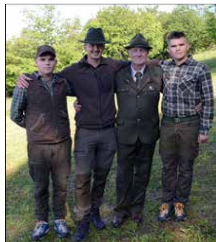
LD Dobrovo ima šest pripravnikov, jubileja pa so se udeležili trije

v čudoviti deželi, ki je bogata z naravnimi danostmi, ki jih je potrebno za vsako ceno ohraniti za prihodnje rodove,« je posebej izpostavil v uvodnem nagovoru in dodal, da je vsekakor prva od dejavnosti zmanjševanje oziroma vzdrževanje stabilne populacije z odstrelom, a obenem lovska družina z namenom omejevanja škod na kmetijskih kulturah v lovišču, velikem 5454 hektarov, izvaja tudi biomeliorativne ukrepe, kot so strojna košnja, ročna košnja, vzdrževanje gozdnega roba in podobno, ter biotehnične ukrepe, kot so krmne njive, preprečevalna krmišča, lovske preže in podobno. Za oba ukrepa letno opravijo nekaj čez 1500 prostovoljnih ur. Posebnost lanskega leta je bil ulov šakala v Medani.