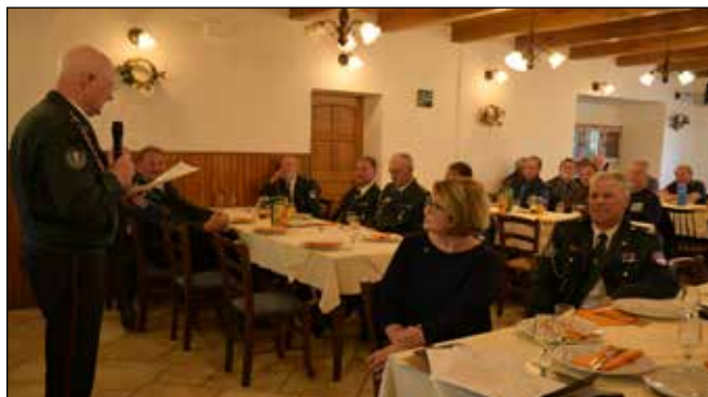
Občni zbor OZVVS