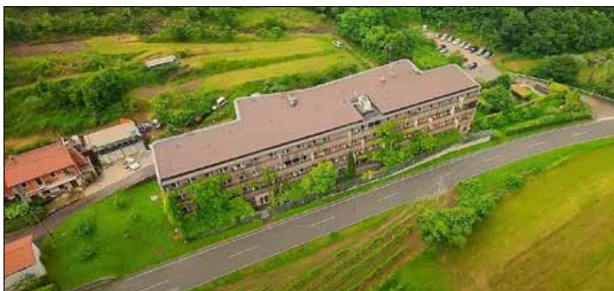
Dom upokojencev Podsabotin