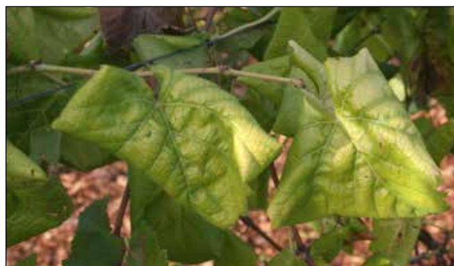
Simptomi okužbe z zlato trsno rumenico pri belih sortah

Navodilo je objavljeno na spletni strani: https://www.gov.si/zlata-trsna-rumenica/