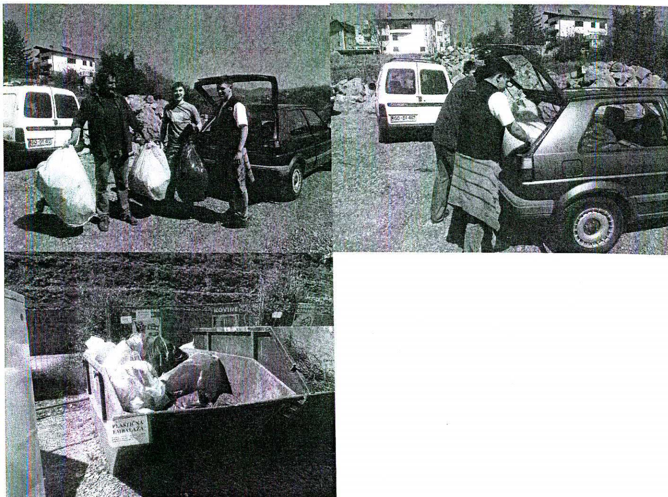
Slika: Akcija očistimo Brda (09.04.2011)

Komunala Nova Gorica d.d. je v prvih 9-ih mesecih namestila 9 zabojnikov za mešane komunalne odpadke (požig), 5 zabojnikov za zabojnikov za papir in karton, 7 zabojnikov za embalažo (kovinska in plastična), 8 zabojnikov za stekleno embalažo, in 33 zabojnikov za biorazgradljive kuhinjske odpadke.