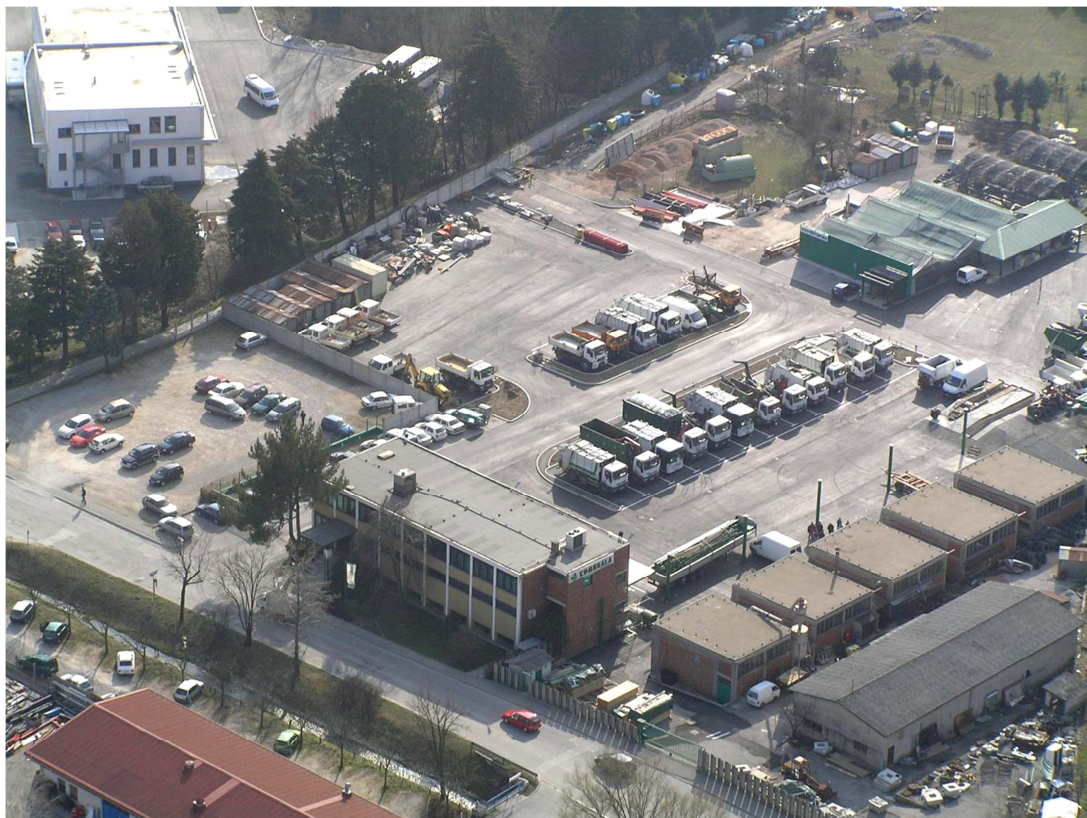
KOMUNALA Nova Gorica d.d., Cesta 25. junija 1, 5000 Nova Gorica, Slovenija